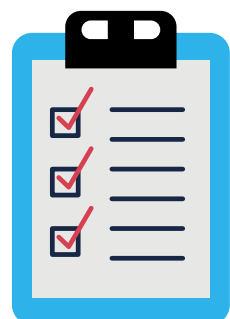
Imagen de la cara delantera de la ficha técnica para facilitar la comprobación de las características del vehículo.

Fotografías del vehículo en las que se pueda apreciar su estado. Al menos necesitaremos una foto de cada lado y otra del interior.